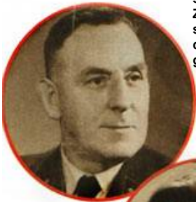
INFAMER LÜGNER Ruths Vater sagte, ihre Zwillinge seien bei der Geburt gestorben